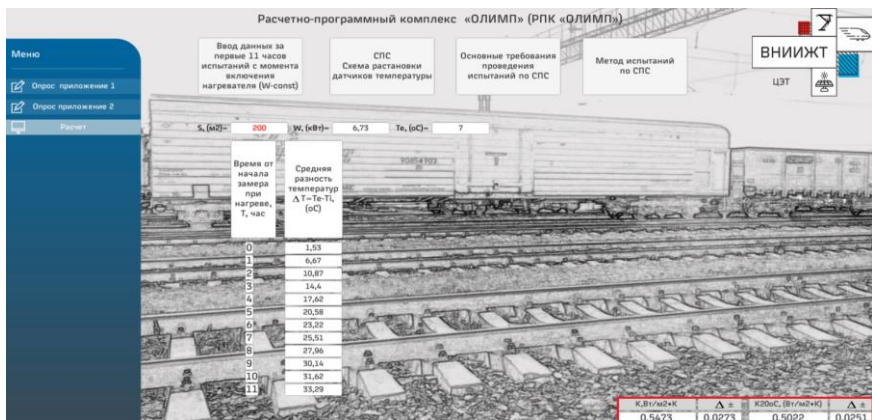
Рисунок 2 – Визуализация расчетных значений К