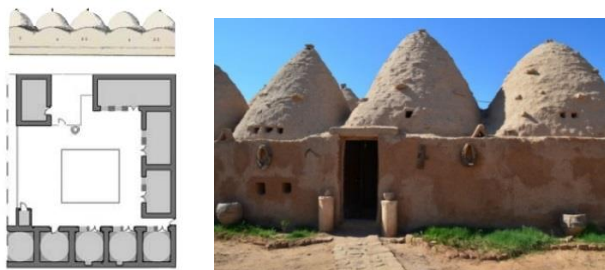
Рисунок 5 – Сельский дом с двором

5 Сельский дом с двором никогда не поднимается выше первого этажа и, как правило, делится на ряд секций: дневную с комнатами для мужчин и комнатами для женщин, кухню и служебные помещения, включая «танур» (традиционную печь), спальную часть и специальную зону для животных с конюшней и стойлами (рисунок 5). В этом типе домов преобладают глиняные конструкции и используются глинобитные купола. Типология дома основана на использовании одного основного блока 4×4 м, перекрытого куполом и повторяющегося по всему внутреннему двору [4].