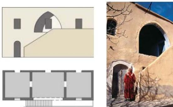
Рисунок 4 – Дом с лиуаном

5 Сельский дом с двором никогда не поднимается выше первого этажа и, как правило, делится на ряд секций: дневную с комнатами для мужчин и комнатами для женщин, кухню и служебные помещения, включая «танур» (традиционную печь), спальную часть и специальную зону для животных с конюшней и стойлами (рисунок 5). В этом типе домов преобладают глиняные конструкции и используются глинобитные купола. Типология дома основана на использовании одного основного блока 4×4 м, перекрытого куполом и повторяющегося по всему внутреннему двору [4].