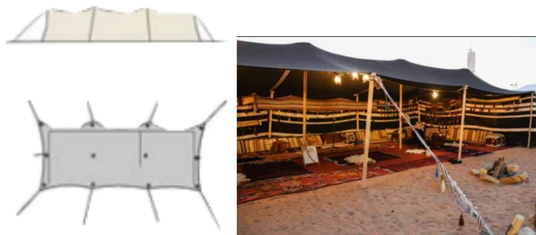
Рисунок 1 – Палатка

1 Палатка – убежище кочевников, используемое как жилище; палатку легко ставить и снимать для переноса (рисунок 1). Жизнь кочевника связана с овцеводством, что означает постоянное перемещение с места на место в поисках пастбищ и подходящей среды для общества и его обитателей. Обычно кочевники передвигаются по пустыне, по равнине, в восточных районах Сирии, у берегов Евфрата и недалеко от турецкой границы [1].