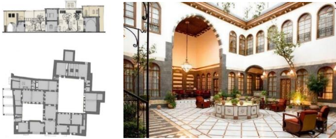
Рисунок 6 – Городской дом с двором

7 Ливанский дом появился во второй половине XIX века и связан с османской современностью и развитием среднего класса в этом районе. Это результат внедрения новых промышленных материалов, а также новых городских правил и программ развития в тот период (рисунок 7).