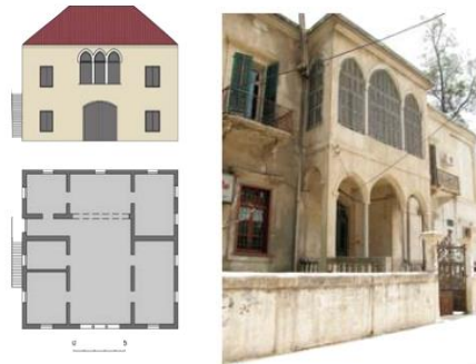
Рисунок 7 – Ливанский дом

7 Ливанский дом появился во второй половине XIX века и связан с османской современностью и развитием среднего класса в этом районе. Это результат внедрения новых промышленных материалов, а также новых городских правил и программ развития в тот период (рисунок 7).