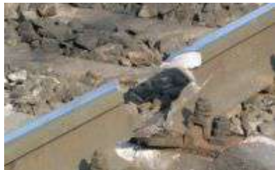
Рисунок 2 – Разрушение рельса под действием ударной нагрузки от колеса при низкой температуре

3 Гравитационные воздействия. Движение вагона под действием силы тяжести по железнодорожному пути с уклоном происходит при величине, превышающей значение, которое обеспечивает преодоление сопротивления среды, встречного ветра и суммарных сил трения в различных взаимодействиях узлов подвижного состава, а также трения покоя, скольжения и качения колеса и рельса.