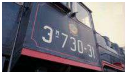
Рисунок 8 – Паровоз серии Э

Самыми мощными дореволюционными грузовыми паровозами были паровозы серии Э, и для Советского Союза эти паровозы оставались основным тяговым средством всё время войны. Средняя весовая норма состава – от 1200 до 1400 тонн. Такой состав прибывал в Ленинград, и если говорить в пересчете на продовольствие, то он привозил почти три дневные нормы для всего города, фронта и флота (рисунки 8, 9).