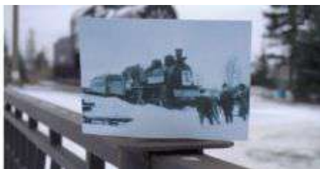
Рисунок 9 – Первый поезд, прибывший по Шлиссельбургской трассе