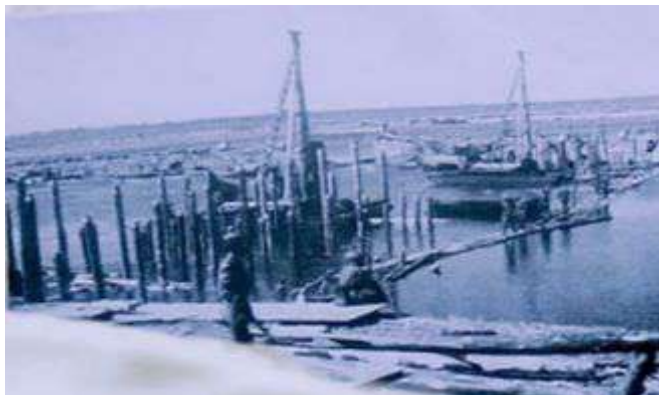
Рисунок 1 – Кадр стройки новой железной дороги

железнодорожный путь протяженностью 33 километра, который проходил бы по Синявинским болотам, по левому берегу Невы. Требовалось построить железнодорожные мосты, которые позволили бы составам проходить в блокадный Ленинград. Новую железную дорогу строили всего в нескольких километрах от линии фронта. Начиналась она от станции Петрокрепость (старое название – Шлиссельбург), далее – через Неву к станции Поляны, которая была связующим звеном с Большой землей. Но с Синявинских высот немцы обстреливали каждый километр этой трассы (рисунок 1) [2].