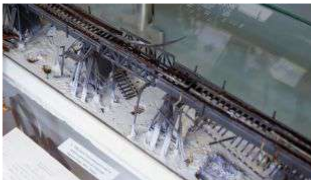
Рисунок 3 – Макет высоковольтного моста свайно-ряжевой конструкции через Неву, 1944 г.

Для автотранспорта нужно было огромное количество машин и бензина, а благодаря близости Волховской ГЭС рассматривался даже такой экзотичный вариант, как строительство троллейбусной трассы. Но троллейбусы в то время были очень тяжелыми, поэтому лед мог их не выдержать (рисунок 4).