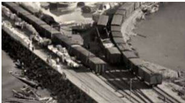
Рисунок 2 – Кадр строительства магистрали

Связать Ленинград с Большой землей с помощью железной дороги пытались с самого начала блокады города, так как только сухопутный вариант мог обеспечить город нормальным снабжением. Трасса через Ладожское озеро – дорога жизни – действовала с сентября 1941 года, но количество грузов, которое через нее перевозили, было недостаточным для огромного города (рисунки 2 и 3).