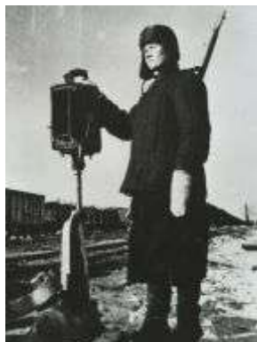
Рисунок 16 – «Живой светофор»

Долгое время широкой общественности было очень мало известно о роли Шлиссельбургской трассы. Название «Дорога Победы» появилось лишь в 1970-е годы. К сорокалетию блокады в 1983 году у насыпи низководного моста поставили памятную стелу (рисунок 17).