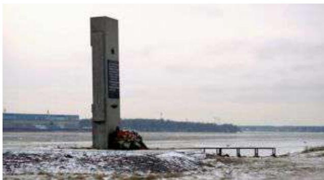
Рисунок 17 – Памятная стела у насыпи низководного моста