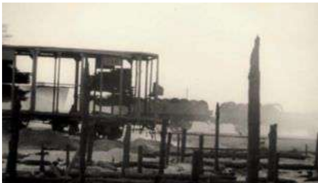
Рисунок 10 – Результат артобстрела

Железнодорожники учились обманывать врага, маскироваться. Поезда решено было пускать только ночью, не включая огней, чтобы немцы не могли засечь движение состава. Но куда девать пар, который идет из паровозной трубы? На более или менее закрытом месте, где были лесопосадки, машинисты набирали высокую скорость, а когда поезд выходил на открытое пространство, закрывали регулятор, с помощью которого управляли выпуском пара. За это время уголь в топке прожигался так, что не было дыма.