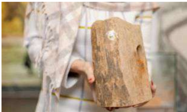
Рисунок 11 – Сваи, использовавшиеся при строительстве ледовой переправы и моста через р. Неву

Татьяна Демидова рассказывает: «Невская вода сохранила для нас вот эти удивительные экспонаты. Это сваи. На свайно-ледовой переправе такие наконечники насаживались потом на дерево, и их забивали в дно Невы. 2560 свай на глубину Невы 6,5 метров, вглубь дна на 4 метра длиной 13 метров заколачивалось одно бревно. Представляете, сколько нужно было леса заготовить, сколько кованых гвоздей на стяжки» (рисунок 11).