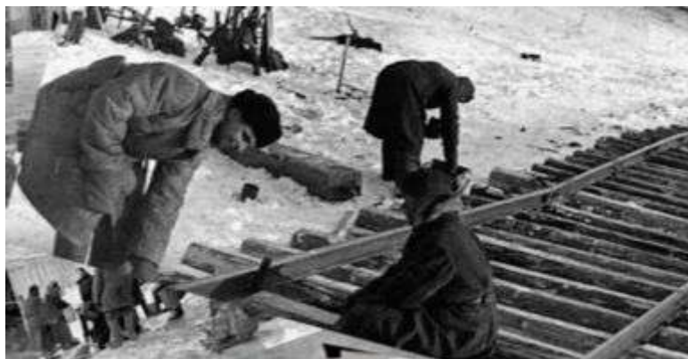
Рисунок 12 – Укладка рельсов с заменой балласта

Чтобы рельсы окончательно не размыло, их надо было поднимать и укреплять. Для этого использовали песчаный и шлаковый балласт. Он находился только в одном месте – в карьере у станции Войбокало. Но немцы усиленно обстреливали этот участок, и днем поезд с балластом проехать никак не мог; пропускали только ночью. Но так как движение поездов осуществлялось только в одну сторону, балласт из карьера вывозили лишь через сутки: в одну ночь шел обычный состав, а в другую – балластный [6, 7].