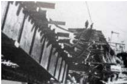
Рисунок 14 – Бригада, расчищающая завал после обстрела

Вдоль всей Шлиссельбургской трассы стояли землянки, где находились ремонтники. Когда снаряды и бомбы разрушали пути, тут же появлялась бригада, которая, не дожидаясь прекращения огня, начинала расчищать завалы (рисунок 14).