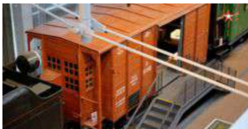
Рисунок 13 – Двухосный крытый вагон

Двухосный крытый товарный вагон, можно сказать, классический для той эпохи, называли «теплушкой». Этот вагон не оборудован автоматической тормозной системой и в нем должен был находиться «тормозильщик», который по сигналу машиниста (три коротких гудка) должен был привести в действие тормоз. От тормозильщиков зависело очень многое: поезд мог получить попадание, получить повреждение, тормозильщик мог быть ранен, но оставался на посту до конца рейса, пока поезд не приходил на станцию. Некоторые так и умирали, истекая кровью на своем посту (рисунок 13).