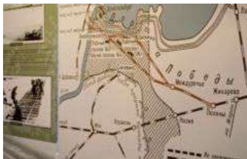
Рисунок 15 – Карта местности с трассой от Междуречья до Шлиссельбурга

Суть такой блокировки заключалась в следующем: на трехметровую жердь укрепляли стрелочный фонарь, две его стороны затемняли, а две другие закрывали цветными стеклами – красным и зеленым. Внутри фонаря была керосиновая лампа. Человек показывал поезду зеленый или красный свет.