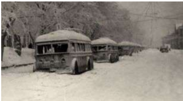
Рисунок 4 – Исторический кадр: зима в Ленинграде в 1941 году

Страшной зимой 1941–1942 годов из-за нехватки продовольствия в блокадном Ленинграде суточная норма упала до ста двадцати пяти граммов хлеба. Поэтому в начале декабря 1942 приступили к реализации уникального проекта: свайно-ледовой железной дороги нормальной и узкой колеи, через Ладожское озеро. Эти обе дороги строили одновременно с двух сторон между берегами Шлиссельбургской губы (рисунок 5).