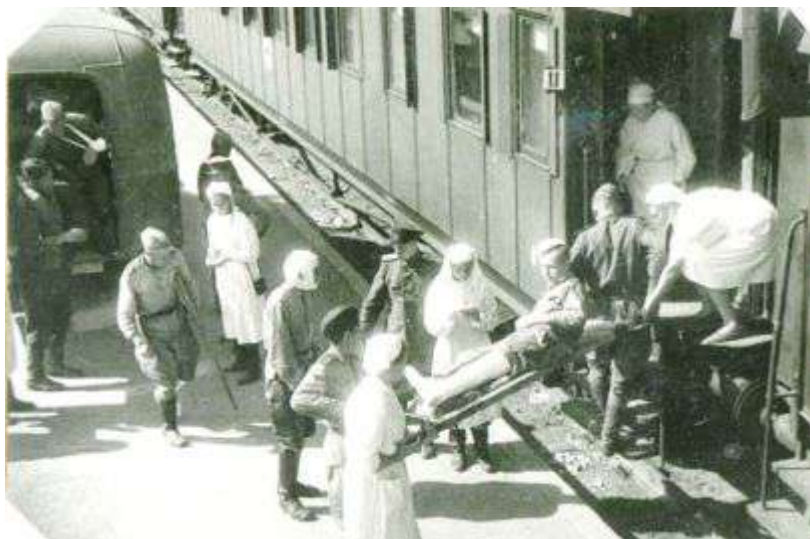
Рисунок 1 – Санитарный поезд

В период Великой Отечественной войны для эвакуации раненых и больных широко использовались военно-санитарные поезда (ВСП) – железнодорожные военно-медицинские учреждения, предназначавшиеся для перевозки на большие расстояния большого количества раненых и больных с их лечением и бытовым обслуживанием в пути (рисунок 1).