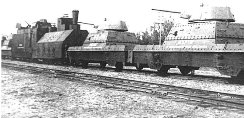
Рисунок 5 – Бронепоезд БП-35

Существовали специальные бронепоезда ПВО. Они состояли из платформ с зенитными орудиями. Подобные бронев вагоны часто прицепляли к эшелонам с особо важными грузами и входили в состав войск противовоздушной обороны. Самым массовым советским бронепоездом на начало войны был БП-35 с легкими площадками ПЛ-35. В 1943 году был разработан БП-43 с площадками ПЛ-43, на каждой из которых устанавливалась башня Т-34 (рисунок 5).