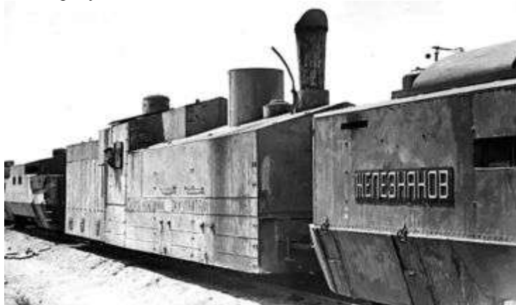
Рисунок 6 – Бронепоезд «Железняков»

Наиболее известным бронепоездом периода войны является «Железняков», который участвовал в обороне Севастополя. Несмотря на господство авиации в воздухе и наличие мощной артиллерийской группировки, немцы ничего не могли поделать с отважным бронепоездом. Он периодически совершал дерзкие вылазки, а затем скрывался в туннелях города. Гитлеровцы прозвали этот поезд «зеленым призраком». На счету «Железнякова» более 140 выездов (рисунок 6) [7].