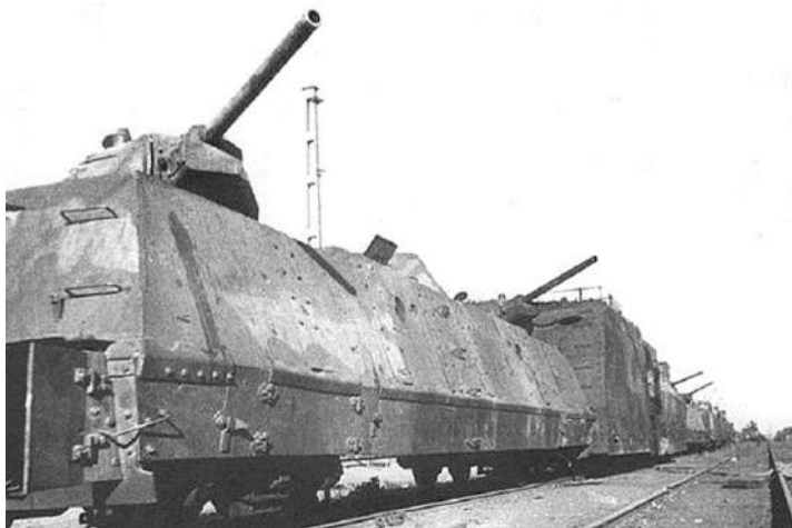
Рисунок 2 – Бронепоезд «Илья Муромец»