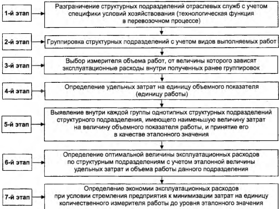
Рис. 3. Основные этапы сравнительного анализа затрат

Автором разработана новая методика сравнительного анализа затрат структурных подразделений, которая позволяет усилить отраслевой принцип анализа затрат (в функциональном разрезе). Этапы анализа представлены на рис. 3.