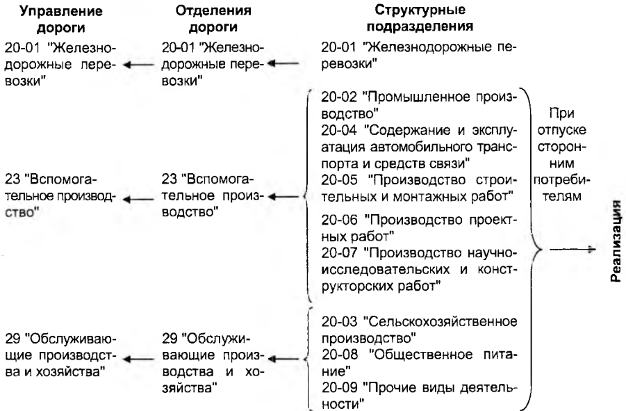
Рис. 1. Движение информации об эксплуатационных расходах предприятий БЖД на всех уровнях управления в процессе составления консолидированной отчетности