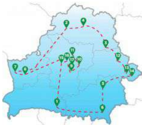
Рисунок 1 – Экскурсионные маршруты «Святыни Беларуси»:

принимает более 15 тыс. паломников. Помимо новых и современных монастырей в Республике Беларусь сохранились и уникальные древние церкви и монастыри, которые также являются зоной тяготения пассажиропотока (рисунок 1).