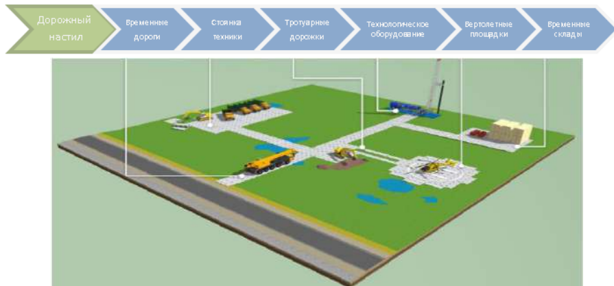
Рисунок 2 – Варианты укладки дорожного настила

Разработанные материалы будут незаменимы при выполнении мероприятий технического прикрытия железнодорожных мостов, станций и перегонов, а также восстановлении объектов при устранении последствий чрезвычайных ситуаций.