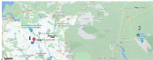
Рисунок 2 – Варианты размещения ВСМ-станции в Минской городской агломерации

Варианты расположения ВСМ-станции в Минской городской агломерации. В результате анализа мирового опыта предлагаются следующие варианты размещения ВСМ-станций в Минской городской агломерации (рисунок 2).