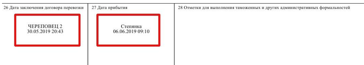
Рисунок 2.20 – Проставление календарных штампов перевозчиком при заключении договора перевозки и при прибытии груза

На станции назначения в накладной в графе 27 «Дата прибытия» проставляется оттиск календарного штампа перевозчика, выдающий груз получателю (рисунок 2.20). В случае неприбытия груза дополнительно проставляется отметка «Груз не прибыл».