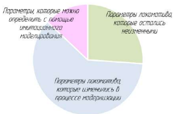
Рисунок 1 – Структура объема параметров, определяемых при испытаниях модернизированного локомотива

На рисунке 1 приведена структура объема параметров, определяемых при испытаниях модернизированного локомотива.