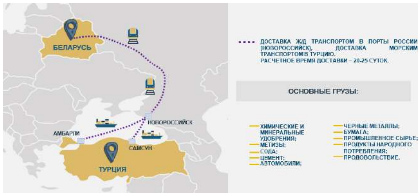
Рисунок 4 – Клиентский сервис по доставке экспортных грузов в Турцию

Среди наиболее перспективных и представляющих интерес для белорусских предприятий является новый сервис БТЛЦ по доставке продукции в сообщении Беларусь – Турция. Сегодня БТЛЦ может оказывать услуги по доставке грузов железнодорожным транспортом в Турцию со станции Колядичи (Беларусь) в порт Новороссийск (Россия), далее морским транспортом в порт Амбарли (Турция), а также порт Самсун (Турция) (рисунок 4).