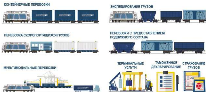
Рисунок 2 – Логистические сервисы и услуги, оказываемые предприятием при организации экспортно-импортных и транзитных перевозок

Развитая материально-техническая база в сочетании с компетенциями специалистов центра и возможностями партнеров позволяет БТЛЦ создавать и предлагать востребованные логистические сервисы, оказывать широкий спектр услуг при организации экспортно-импортных и транзитных перевозок, таких как организация контейнерных и мультимодальных перевозок, перевозка скоропортящихся грузов, экспедирование, перевозки с предоставлением собственного и привлеченного подвижного состава, оказание услуг терминальной логистики и таможенного оформления (рисунок 2).