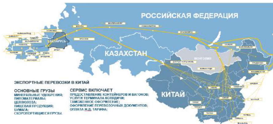
Рисунок 3 – Клиентский сервис по доставке экспортных грузов в Китай

Помимо организации перевозок основной номенклатуры грузов, БТЛЦ также организует перевозки скоропортящейся продукции в рефрижераторных контейнерах через Владивостокский морской торговый порт в Китай. В настоящее время центр может доставить такой вид продукции в порты Циндао, Шанхай, Нингбо, Далянь Китайской Народной Республики. Всего в этом году было перевезено порядка 1700 т грузов, требующих поддержания температурного режима. Основу этих грузов составили субпродукты кур домашних и замороженная говядина.