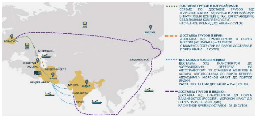
Рисунок 5 – Маршруты перевозок в Азербайджан, Иран, Индию

В Иран груз доставляется железнодорожным транспортом с терминала Колядичи в порт Астрахань (РФ) с дальнейшей отправкой морским транспортом (на условиях LIFO) в порты Ирана и автомобильным транспортом до конечного получателя. В зависимости от расписания и очереди время ожидания загрузки судовой партии в порту Астрахани может составить от 5 до 30 суток. С момента погрузки на паром доставка в порт Бендер – Энзели (Иран) составляет 4–5 суток. Ориентировочный срок доставки груза составляет до 25 суток.