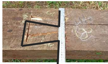
Рисунок 5 – Составление крайнего и среднего элементов после их выпиливания