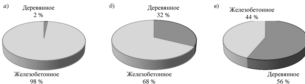
Рисунок 1 – Распределение подрельсового основания по состоянию на 01.01.2023 года: а – на главных путях; б – на станционных путях; в – на путях необщего пользования

Подрельсовое основание на Белорусской железной дороге (БЖД) представляет собой железобетонные и деревянные шпалы, железобетонные и деревянные переводные и мостовые брусья. Распределение полигона деревянного и железобетонного основания в зависимости от сферы применения представлено [1] на рисунке 1.