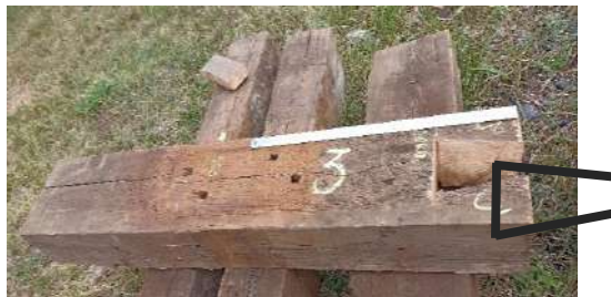
Рисунок 4 – Изготовление крайних элементов с выпиливанием «паза»

– формирование схемы нагружения рельсового узла транспортной нагрузкой; – определение параметров расчетной сетки для модели составной шпалы; – прочностной расчет с анализом схемы нагружения, в результате которого программа не выдала предупреждений о превышения прочностных пределов, что говорит о возможности конструкции выдержать нагрузку от подвижного состава без потери надежности. Таким образом, можно предположить, что модель является адекватной и возможно переходить к практическим экспериментам (рисунки 4 и 5).