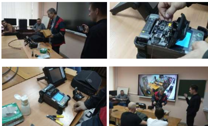
Рисунок 1 – Лекционно-практическое занятие с участием представителей ГО «Белорусская железная дорога»

Самые худшие показатели усвоения информации у лекционного формата – всего 10 %. Лучший результат при применении знаний на практике – 90 %. Второй по лучшему усвоению подход – практические занятия, благодаря им можно усвоить даже новый материал на 70 % (рисунок 2). Поэтому в университетах лекции всегда совмещают с практикой.