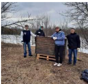
Рисунок 1 – Студенты университета помогают обустроить пункт содержания животных

Помогая решать эти задачи молодые люди получают неоценимый опыт воспитания внутри себя настоящего гражданина, человека, не способного пройти мимо чьей-то беды, способного оказать помощь и поддержку. Наверное, это и есть, пусть маленькая – частичка нашей национальной идеи.