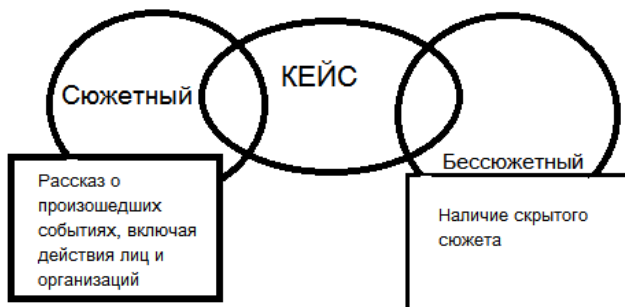
Рисунок 1 – Классификация кейсов по принципу наличия сюжета

Характеристика сюжетного кейса приведена на рисунке 2.