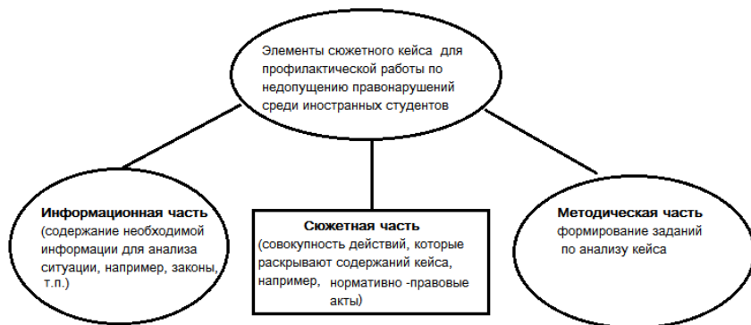
Рисунок 2 – Элементы сюжетного кейса

Характеристика сюжетного кейса приведена на рисунке 2.