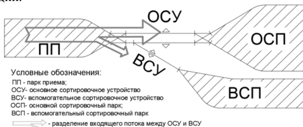
Рисунок 2 – Разделение входящего потока между сортировочными устройствами

Так, при выделении потока составов на специализированное сортировочное устройство [5, 6] (рисунок 2) их доля будет обозначаться как \alpha_d^1 , а оставшаяся часть потока, направляемая на основное устройство – \alpha_d^0 . Коэффициент диверсификации, по нашему мнению, является важной характеристикой, которая может использоваться для определения эффективности специализации.