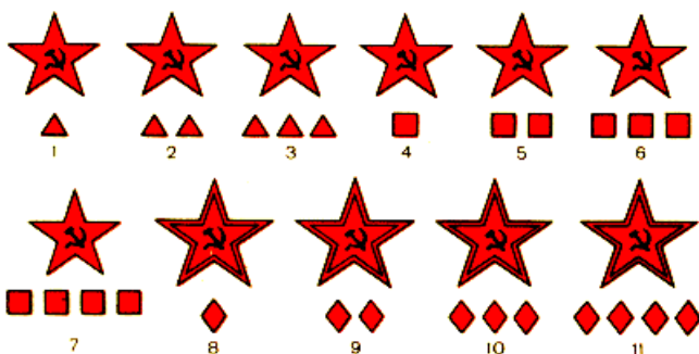
Рисунок 1 – Нарукавные знаки различия командного состава, введенные 16 января 1919 года: 1 – отдельный командир, 2 – помощник командира взвода, 3 – старшина, 4 – командир взвода, 5 – командир роты, 6 – командир батальона, 7 – командир полка, 8 – командир бригады, 9 – начальник дивизии, 10 – командующий армией, 11 – командующий фронтом

В начале 1922 года в Красной Армии была введена единая строго регламентированная форма одежды. Изменилось положение знаков должностного положения на военной одежде. С января 1922 года знаки различия военнослужащих стали размещаться на специальном клапане из сукна, обрамленном алым кантом (рисунок 2).