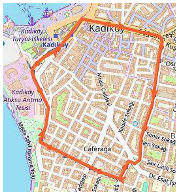
Рисунок 2 – Карта-схема маршрута Т3

В настоящее время исторический трамвай Стамбула в большей степени является не общественным транспортом, а туристической достопримечательностью и развлекательным аттракционом, позволяющим пассажирам, сидя на деревянных скамьях, осматривать город из деревянных окон старого трамвая.