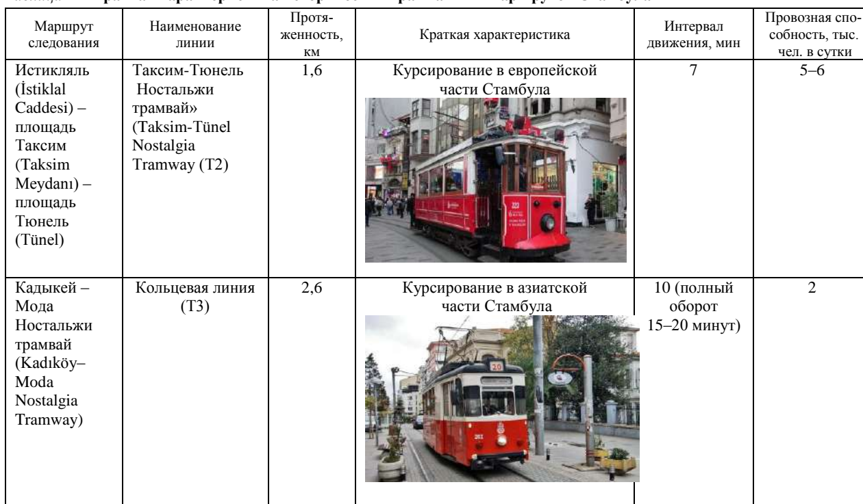
Таблица 1 – Краткая характеристика исторических трамвайных маршрутов Стамбула

Линия исторического трамвая не связана с остальным общественным транспортом Стамбула, но при этом включена в общую нумерацию и является маршрутом Т2, который за последние 100 лет совершенно не изменился, что позволяет демонстрировать гостям города старую трамвайную систему Стамбула (рисунок 1).