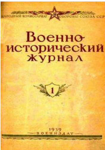
Обложка первого номера «Военно-исторического журнала». 1939 год

Огромную роль в патриотическом воспитании молодежи сыграл кинематограф. Его идеологические и пропагандистские возможности Сталин оценивал чрезвычайно высоко. Накануне Великой Отечественной войны советские кинематографисты создали серию великолепных историко-патриотических кинолент: «Чапаев» (1934 г.) братьев Васильевых, «Пётр Первый» (1937–1939 гг.) В. Петрова, «Великий гражданин» (1938–1939 гг.) Ф. Эрмлера, «Минин и Пожарский» (1939 г.) В. Пудовкина и М. Доллера, «Суворов» (1941 г.) В. Пудовкина. Самым ярким и в наибольшей степени отвечавшим национальному самосознанию советского народа стал фильм С. Эйзенштейна «Александр Невский» (1938 г.). Гениальную музыку к нему написал композитор С. Прокофьев. Фильм готовил советский народ к жесткой схватке с беспощадным врагом и прямо указывал, кто им станет.