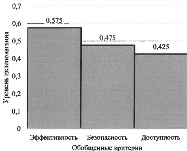
Рисунок 2 – Уровень целевой направленности статей закона РБ «О железнодорожном транспорте»

Оценка обеспечения основных требований эффективности, безопасности и доступа в статьях закона «О железнодорожном транспорте» [14] показывает, что уровень практической направленности высокий: 93 % статей (из 40 статей) имеют целевое практическое применение для субъектов правоотношений на железнодорожном транспорте РБ. При этом высоким является уровень целеполагания в статьях закона по основным обобщенным критериям: эффективности – 0,575, безопасности – 0,475, доступности – 0,425 (рисунок 2). В части статей установлены нормы права по нескольким обобщенным критериям: в 6 статьях по трем критериям, в 11 статьях – по двум критериям.