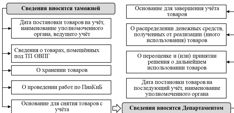
Рисунок 3 – Порядок внесения сведений в Единую систему уполномоченными органами

Итак, после устранения всех выявленных проблем, ведение учёта товаров в Единой системе будет представлять собой постепенное внесение в неё информации о товарах, которая отражена на рисунке 3.