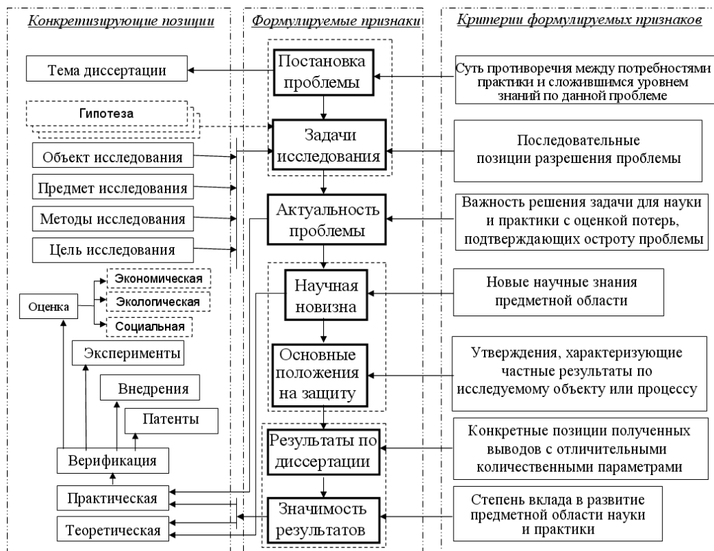
Рисунок 1 – Характеризующие признаки и их структура

щая структура характеризующих позиций представлена на рисунке 1.