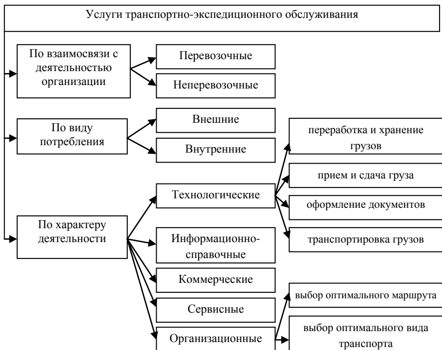
Рисунок 1 – Классификация услуг транспортно-экспедиционного обслуживания

Информационные услуги развиваются активнее, чем другие виды услуг, однако трудно поддаются стоимостной оценке. Определить же реальную стоимость информации можно на основании двух факторов: ее достоверности, своевременности и необходимости, значимости для клиента в определенный момент.