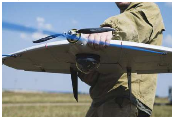
Рисунок 2 – Беспилотные летательные аппараты, входящие в состав беспилотных авиационных комплексов: а – «Москит»; б – «Суперкам С-100»

Они предназначены для ведения воздушной оптико-электронной разведки местности в любое время суток. Основными задачами являются: определение координат объекта; выполнение полетного задания в автоматическом режиме с возможностью его изменения с наземного пункта управления; наблюдение и получение фото– или видеосъемки; получение и передача изображений обнаруженных объектов и местности в любое время суток.