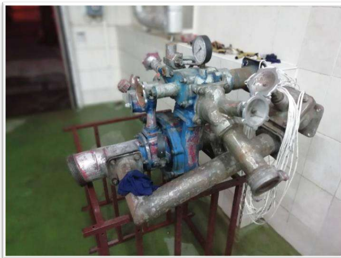
Рисунок 1 – Внешний вид смонтированного на основании насоса

В качестве прототипа был взят широко распространенный вышедший из строя насос ПН-40У (рисунок 1).