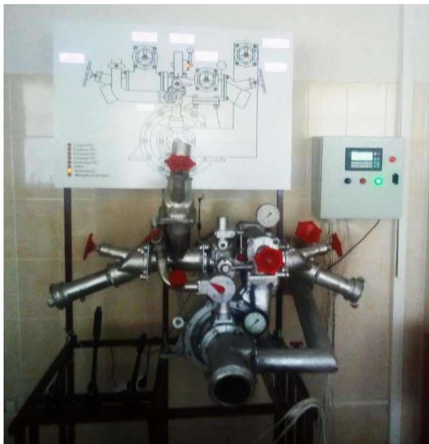
Рисунок 3 – Внешний вид разработанного тренажера

Использование разработанного тренажера позволяет повысить навыки водителей без использования автоцистерн, а также снизить финансовые затраты на амортизацию пожарных автомобилей и топливо.