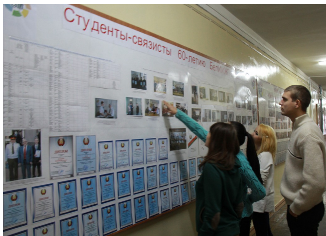
Рисунок 2 – У юбилейного кафедрального стенда, посвященного НИРС

продуманность ее тематики, объем и доходчивость изложения материала, правильно выбранные иконография и дизайн. Информация со стендов представлена и на сайте кафедры.