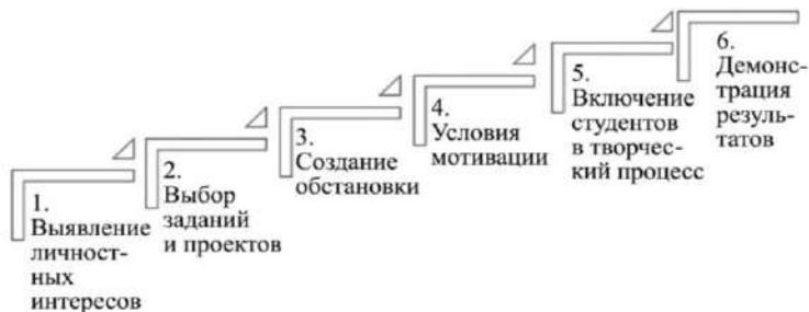
Рисунок 1 – «Ступенчатая модель» развития творческих способностей

Развитие творческих способностей студента можно представить в виде перечня условий, соблюдение которых в дальнейшем развивает неординарность мыслей, возможность нестандартно действовать в различных ситуациях. Выполнение перечисленных условий должно происходить поэтапно (рисунок 1).