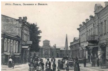
Либавский вокзал в Гомеле, нач. XX века