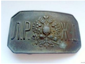
Форменная пряжка служащего Либаво-Роменской железной дороги