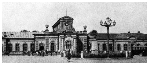
Либавский вокзал, вид со стороны Замковой улицы, нач. XX век

В 1913 году протяженность дороги с ее ветвями составляла 1344 версты, из них 183 версты – двухпутные. В подвижном составе насчитывалось 428 паровозов, 11530 товарных и 405 пассажирских вагонов.