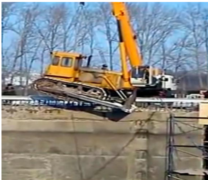
Рисунок 1 – Скриншот видеоролика «Падение крана»