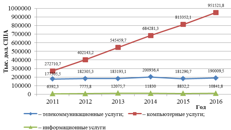
Рисунок 1 – Экспорт услуг высокотехнологического сектора

Рассматривая экспорт услуг высокотехнологического сектора Республики Беларусь в период 2011–2016 гг., можно отметить положительную динамику по всем трём составляющим: телекоммуникационные, компьютерные и информационные услуги. Наибольший рост приходится на компьютерные услуги, экспорт которых за рассматриваемый период возрос на 678811,1 тыс. дол. США, в частности их доля в общем объеме экспорта в 2016 году стала составлять 82,6 % (59,8 % в 2011 году) (рисунок 1) [11].