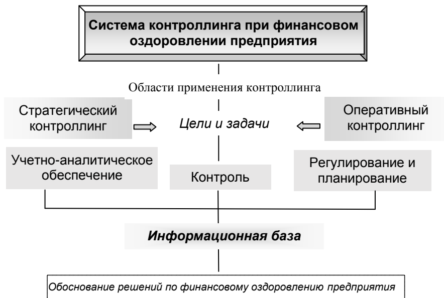
Рисунок 1 – Элементы системы контроллинга при финансовом оздоровлении предприятия

Область применения системы контроллинга предприятия в процессе финансового оздоровления характеризуется причинно-следственными связями экономического, социального и юридического характера, обуславливающими изменение плановых, фактических и прогнозных показателей финансово-хозяйственного состояния предприятия и состояния его взаимоотношений с кредиторами.