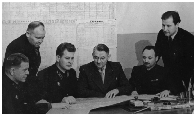
Научное обсуждение с учеными БелиИЖТа новых технологий работы станций Белорусской железной дороги (1957 г.)