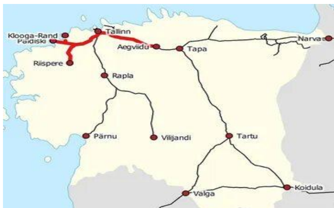
Рисунок 2 – Схема железных дорог Эстонии

Характеристика железной дороги Эстонии. Акционерное общество «Эстонская железная дорога». ЭВР (AS «Eesti Rauttee»), образована с 1991 г., основной перевозчик грузов в стране; пассажирские перевозки осуществляют АО «Электрическая железная дорога» (с 1998 г.) на прилегающих к Таллину участках, АО «Юго-Западная железная дорога» во внутреннем сообщении и АО ЭВР Экспресс (владеет 49 % акций АО «Эстонская железная дорога») в международном сообщении. Является членом ОСЖД (код ЭВР). Основной железнодорожный узел расположен в Таллине. К 2005 году общая длина Эстонских железных дорог составила 1320 км, из которых электрифицировано 132 км. Ширина колеи составляет 1520 мм. На линиях находится 60 станций и 129 перронов (рисунок 2).