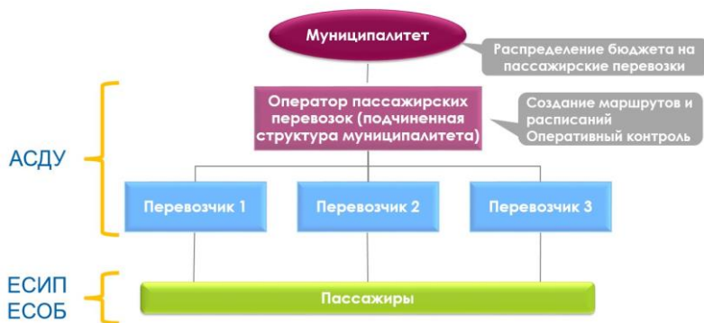
Рисунок 4 – Организационная схема

Организационная схема должна также включать в себя такие важные составляющие, как единая система информирования пассажиров (далее – ЕСИП) и единая система оплаты проезда и бронирования билетов (далее – ЕСОБ) (рисунок 4).