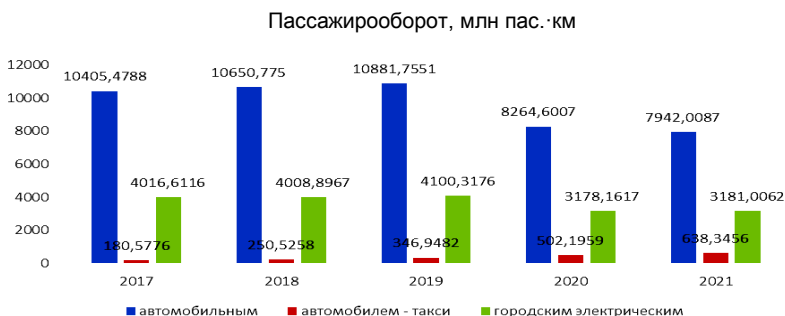
Рисунок 2 – Пассажирооборот на автомобильном, городском электрическом транспорте, а также при выполнении перевозок пассажиров автомобилями-такси в 2017–2021 гг.

По данным статистической отчетности за 2022 год объем перевозок пассажиров автомобильным, городским электрическим транспортом и метрополитеном составил 1455,4 млн пас., что на 1,9 % меньше, чем за тот же период 2021 г. (1483,8 млн пас.).