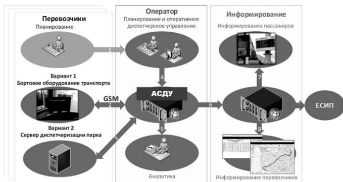
Рисунок 5 – Организационно-техническая схема

Создание механизма постоянного сотрудничества и взаимодействия между участниками системы, обеспечивающего координацию действий, обмен опытом и знаниями, а также совместное решение возникающих проблем приведет к развитию системы в долгосрочной перспективе (рисунок 5).