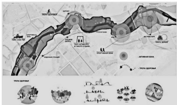
Рисунок 1 – Территория реки Днепр. Концепция развития

Для улучшения существующей ситуации общественных пространств города предлагается следующая тенденция развития: создание четырех активных зон, чередующихся с естественным ландшафтом (рисунок 1) (1 – зона парка семи рек; 2 – парк, который соединяется с Покровским через мост; 3 – зона спорта; 4 – озёра зеркал) [3; 5].