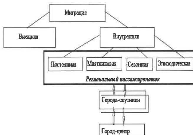
Рисунок 1 – Схема формирования регионального пассажиропотока на железнодорожном транспорте за счет внутренней миграции

внутренней миграцией и формирующие региональный пассажиропоток на железнодорожном транспорте (рисунок 1).