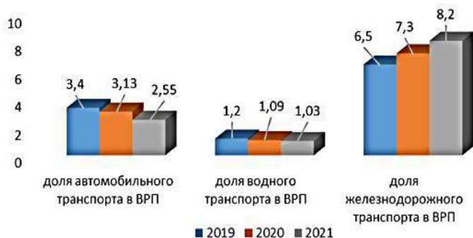
Рисунок 1 – Динамика доли транспорта в ВРП

В регионе происходит ежегодное изменение доли транспортной отрасли в валовом региональном продукте. Наибольшую долю в структуре ВРП занимает железнодорожный транспорт. На его долю, по данным 2021 года, приходилось 8,2 %, что выше уровня 2019 года. Доля автомобильного транспорта напротив имеет тенденцию к сокращению. По данным 2021 года, он составлял 2,55 %. Доля водного транспорта составляет 1 % от ВРП. Динамика изменения доли транспорта (по видам) представлена на рисунке 1.