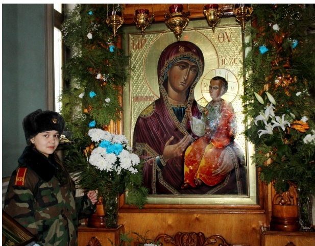
Иверский храм (фото 1)

благополучии близких и разрешении житейских проблем не остаются не услышанными Божьей Матерью, потому что многие прихожане идут сюда с верой и им обязательно воздается по вере.