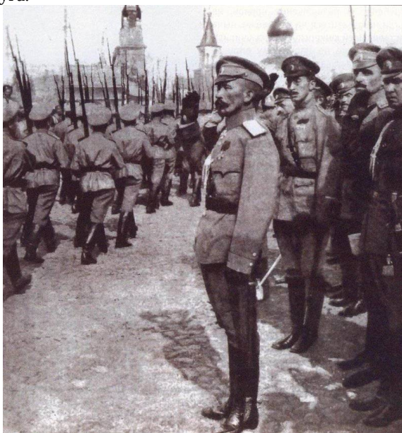
Рисунок 1 – Лавр Корнилов принимает смотр 1917 год

Личность Корнилова (рисунок 1) стала известной в России после событий 1916 года, когда он сумел бежать из австрийского плена. 2 марта 1917 года Корнилов по поручению начальника Главного штаба генерала Михневича был назначен ещё Николаем II командующим Петроградского военного округа.