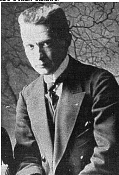
Рисунок 3 – Керенский А. Ф. в рабочем кабинете

После провала корниловского мятежа Александр Керенский (рисунок 3) провозгласил Россию республикой, власть перешла Директории, состоящей из пяти человек во главе с ним самим.