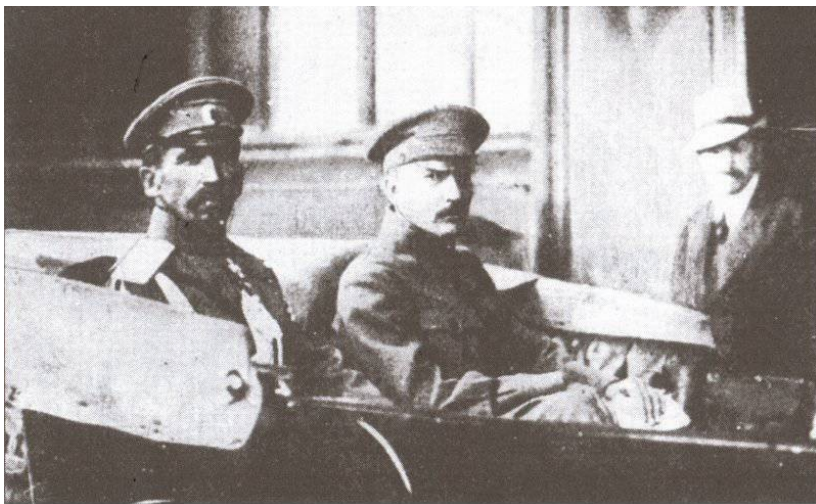
Рисунок 2 – Генерал Корнилов Л. Г. и Савинков Б. В.

перебрасывать военные части к столице. Это был 3-й конный корпус дивизия генерала Крымова А. М. и Туземная (неофициально называющаяся «Дикой», состоявшей из кавказских конных воинов) генерал-лейтенанта Багратиона Д. П. Помимо этого, с севера, со стороны Финляндии на Петроград двигался кавалерийский корпус генерал-майора Долгорукова А. Н.