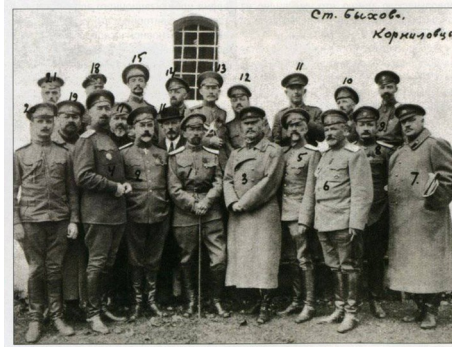
Рисунок 4 – Генералитет, узники быховской тюрьмы осенью 1917 года.

По номерам: 1. Л. Г. Корнилов. 2. А. И. Деникин. 3. Г. М. Ванновский.