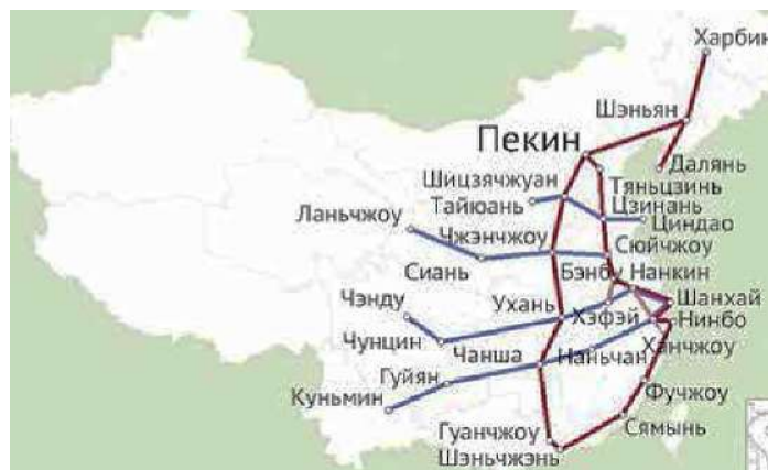
Рисунок 1 – Высокоскоростное железнодорожное сообщение Гуанчжоу с городами КНР

Город Гуанчжоу (провинция Гуандун) является одним из крупнейших мегаполисов КНР, численность которого превышает 12 млн человек. В настоящее время г. Гуанчжоу интенсивно развивающийся крупнейший торгово-промышленный, научно-технический, образовательный, культурно-исторический и транспортный центр страны, расположенный на юге материкового Китая, который связан регулярными железнодорожными маршрутами со многими городами Китая (рисунок 1).