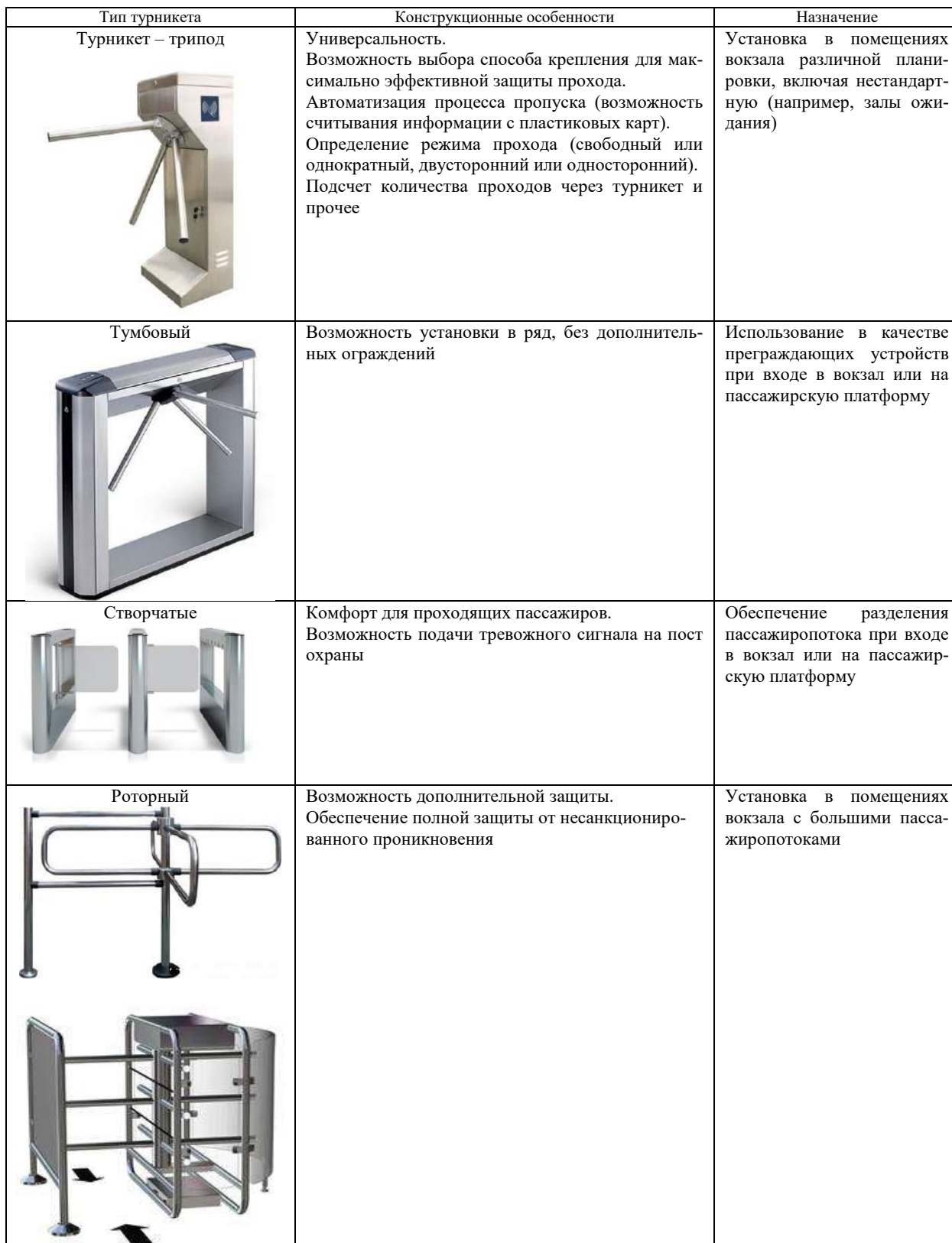
Таблица 1 – Краткая характеристика турникетов, обеспечивающих безопасность и разделение пассажиропотока на железнодорожных вокзалах