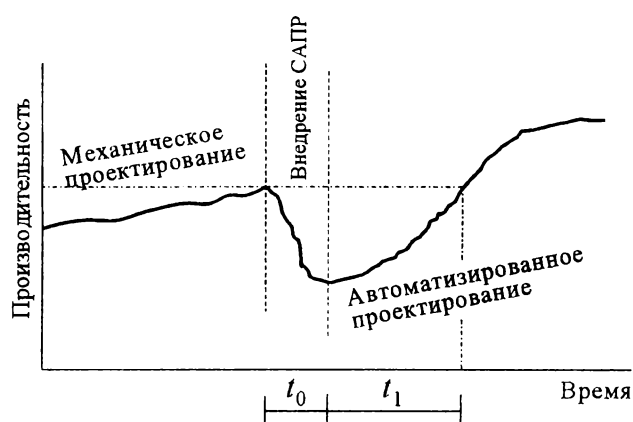
Рисунок 1 – График изменения производительности труда проектировщиков при внедрении САПР

уклад труда проектировщиков, поэтому внедрение информационных технологий в практику проектирования сначала приводит к снижению эффективности работы системы (рисунок 1).