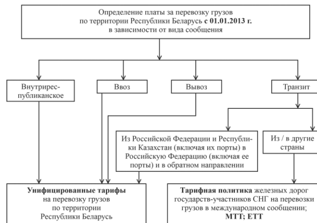
Рисунок 2 – Порядок расчета провозной платы после унификации грузовых тарифов

В соответствии с Соглашением с 1 января 2013 года для определения тарифов и расчета провозных плат при перевозках грузов во внутриреспубликанском сообщении, ввозе и вывозе грузов на территорию Республики Беларусь, а также при транзите из Российской Федерации и Республики Казахстан (включая их порты) в Российскую Федерацию (включая ее порты) и в обратном направлении применяется унифицированный тариф, а при транзитных перевозках из/в другие страны тарифы за перевозку по территории Республики Беларусь по-прежнему определяются в соответствии с действующими международными соглашениями (рисунок 2).