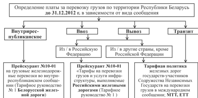
Рисунок 1 – Порядок расчета провозной платы до унификации грузовых тарифов

До 31 декабря 2012 года для определения тарифов и расчета провозных плат применялись документы, приведенные на рисунке 1.