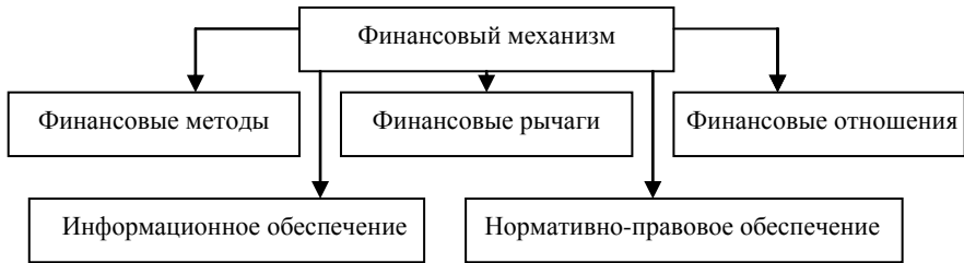
Рисунок 1 – Структура финансового механизма предприятия

Проведенное исследование дает возможность представить структуру механизма финансового обеспечения концессионной деятельности в Украине (рисунок 2).