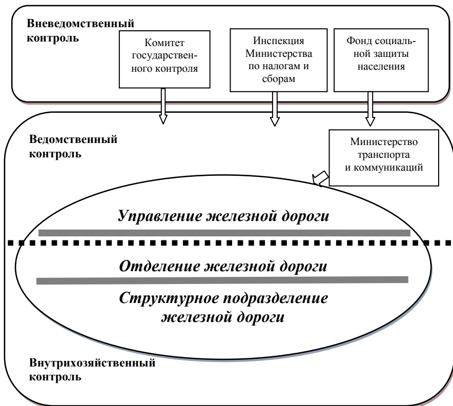
Рисунок 1 – Система «многоуровневого» контроля финансово-хозяйственной деятельности железной дороги

В-третьих, финансовые ресурсы дороги, отделений дороги и их структурных подразделений формируются через систему внутриотраслевых экономических отношений: Управление железной дороги осуществляет расчеты с отделением за выполненные работы по перевозкам; отделения дороги, в свою очередь, осуществляют финансирование подведомственных им структурных подразделений. Отсюда следует, что контроль доходов складывается из двух направлений: контроль полноты и своевременности доходных поступлений за оказанные услуги и контроль за обоснованностью выделения средств под финансирование хозяйственной деятельности отделений и структурных подразделений железной дороги способом взаимной сверки расчетов различных уровней управления.