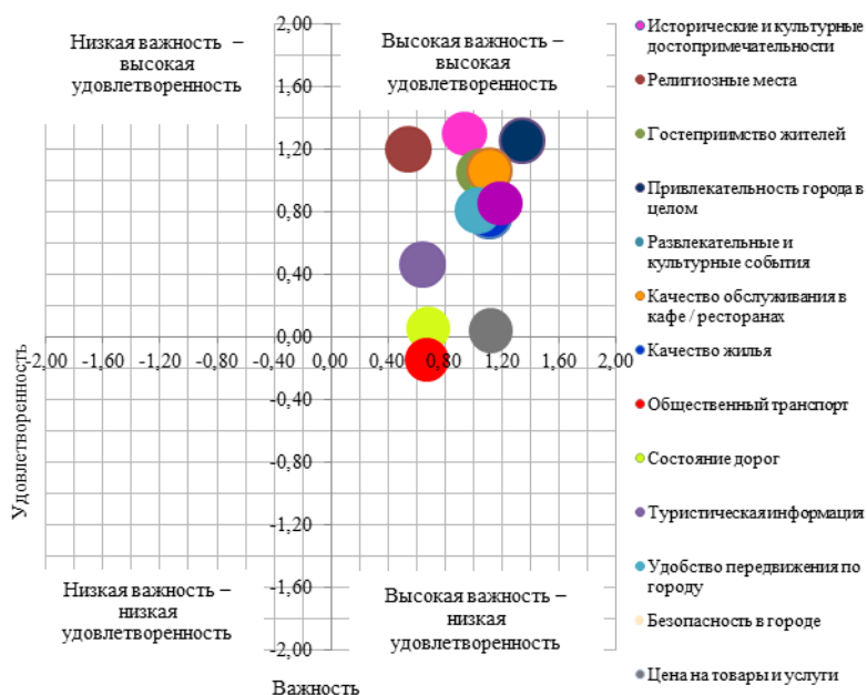
Рисунок 3 – Качество предоставления туристических услуг (сформировано по данным анкетирования сентябрь – октябрь 2016 года)

К группе «высокая важность – низкая удовлетворенность» принадлежат критерии, которые являются очень важными, однако недостаточно удовлетворенными. Как видим, в эту группу попали те факторы, которые требуют особого внимания: общественный транспорт, который уменьшает общий показатель удовлетворенности туристическими услугами.