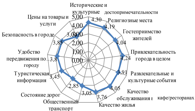
Рисунок 2 – Оценка путешествия в городе Чернигове (сформировано по данным анкетирования сентябрь – октябрь 2016 года)

Индекс туристической привлекательности города формировали такие показатели, как исторические и культурные памятники, религиозные места, гостеприимство жителей и привлекательность города Чернигова для туристов в целом. Данные приведены на рисунке 2.