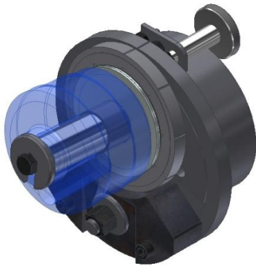
Рисунок 1 – Приспособление для обработки карманов ротора А1-112/25.10.000СБ аксиально-поршневого насоса