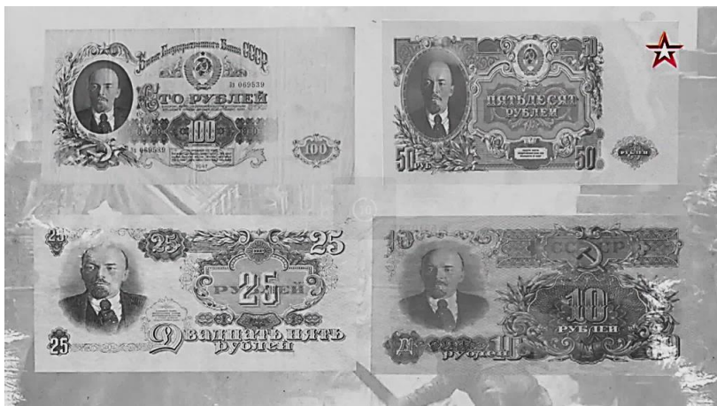
Рисунок 3 – Изображения банкнот СССР после денежной реформы 1947 года

Военные расходы СССР составили 580 миллиардов рублей (192 миллиарда долларов в ценах 1945 года), что было меньше, чем расходы Германии.