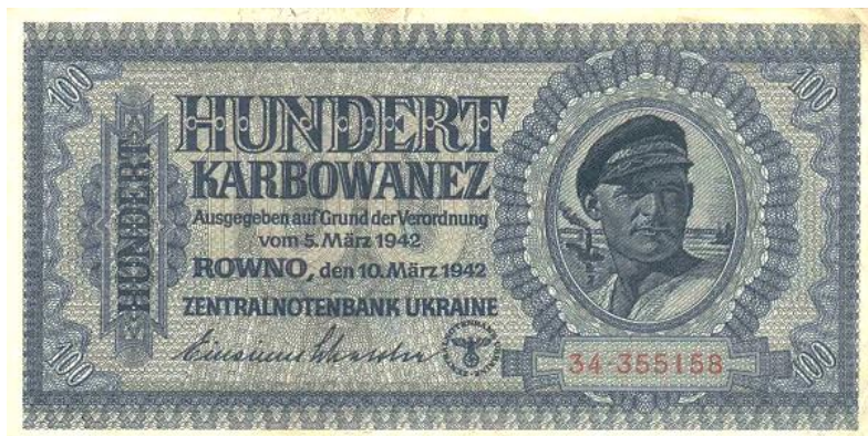
Рисунок 2 – Изображение карбованца 1942 года

Секретную операцию «Монастырь» готовил спецотдел Генерального штаба Красной Армии при личном участии Иосифа Сталина. Основная цель радиоигры была в том, чтобы заполнить эфир дезинформацией стратегического значения.