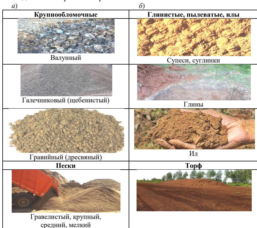
Рисунок 1 – Пример оснований:

На рисунке 1 приведены примеры оснований, которые могут работать как модель Винклера и Пастернака.