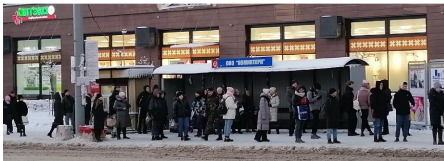
Рисунок 1 – Фотофиксация текущей ситуации на остановке «Коминтерн»

Для ознакомления с параметрами остановочного пункта «Коминтерн» рассмотрим таблицу 1.