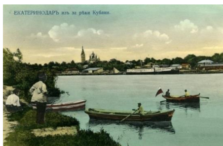
Рисунок 1 – Вид на Екатеринодар из-за реки Кубани, 1904 г. Изд. Мееровича, тип 1

Во второй половине XX в. вплоть до середины 1990-х гг., благодаря полноводности р. Кубани, протекающей в южной части Краснодара, речной флот был составным элементом организованной «единой системы транспорта» [4, с. 21], в котором работало три порта. Особенностью архитектурной деятельности на протяжении вышеотмеченного периода стало регулирование функционального зонирования прибрежных территорий – размещение жилых кварталов, социальных объектов на месте бывших предприятий коммунально-складского назначения.